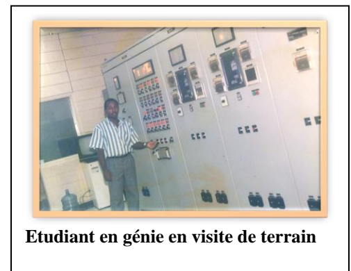
Etudiant en génie en visite de terrain