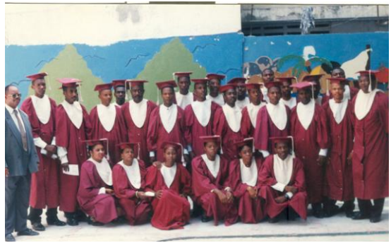
Les gradués : Promotion 90-94

Participation des facultés d'informatique, de génie et d'agronomie au salon de l'innovation de la CONATEL : 20 Mai 2008